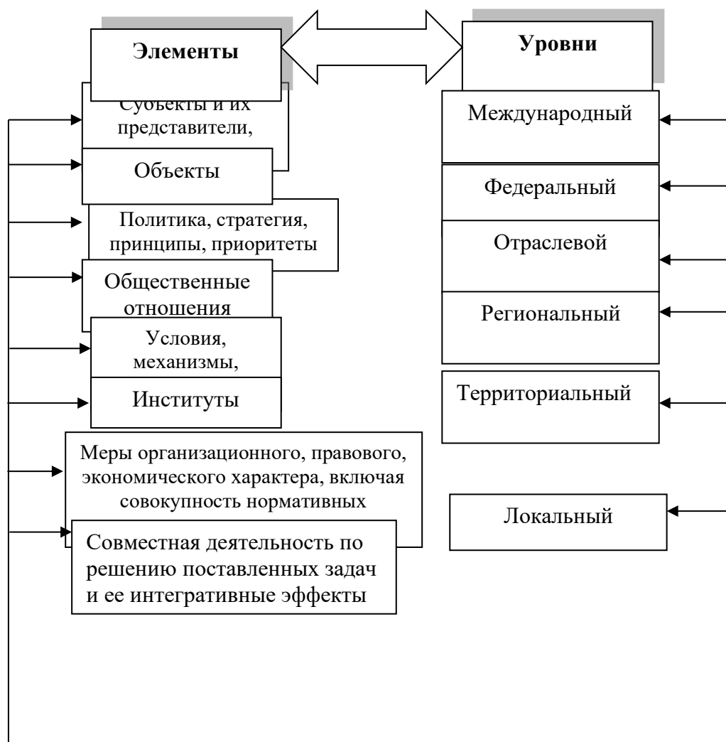
Рисунок 1 - Система социального партнерства 202

Как видно из рисунка, данная система многоуровневая, раскрывающая составляющие социального партнерства в их взаимозависимости.