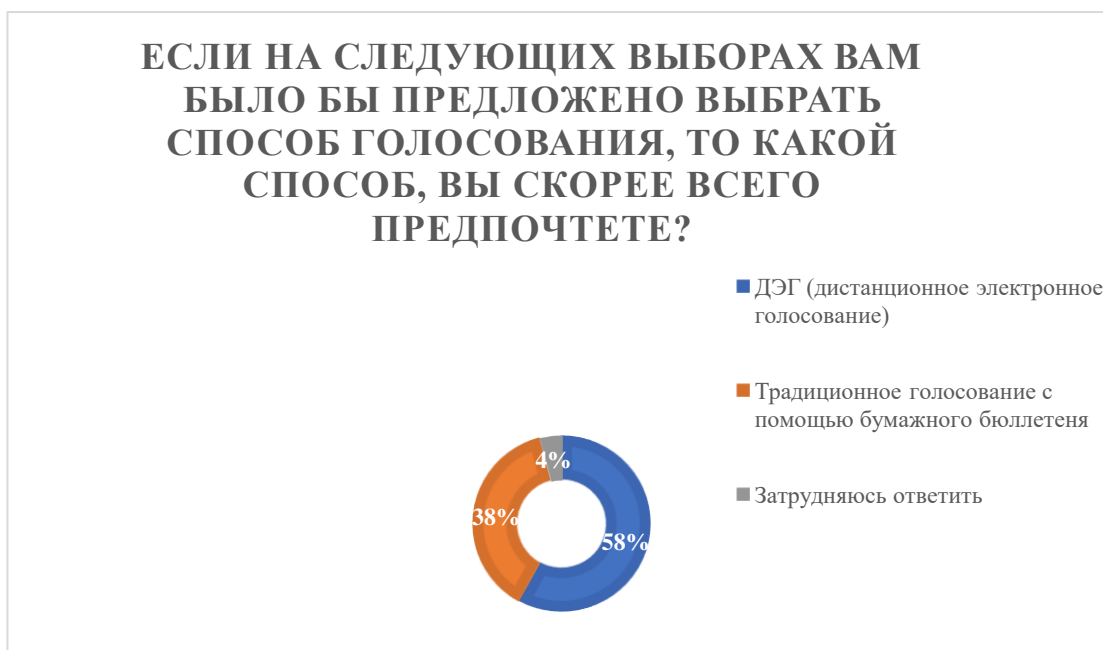
Рисунок 1. Если на следующих выборах Вам было бы предложено выбрать способ голосования, то какой способ, Вы скорее всего предпочтете?

Каждый опрошенный информирован о системе дистанционного электронного голосования, 80% относятся к нему положительно, а 20% сомневаются в выборе своего предположения. Лидерам молодежного общественного суждения был задан вопрос: «Если на следующих выборах Вам было бы предложено выбрать способ голосования, то какой способ, Вы скорее всего предпочтете?». Самарская молодежь в этом вопросе разделилась в предположениях.