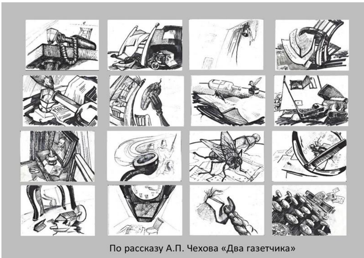
По рассказу А.П. Чехова «Два газетчика»