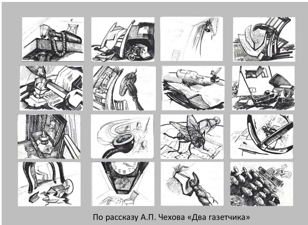
Рисунок 4 – Сюжетная раскладка по рассказу А.П.Чехова «Два газетчика»